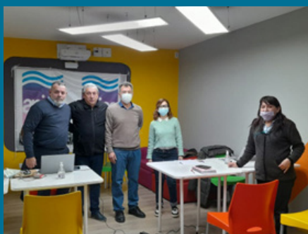
APJAE ANSES EN JUJUY