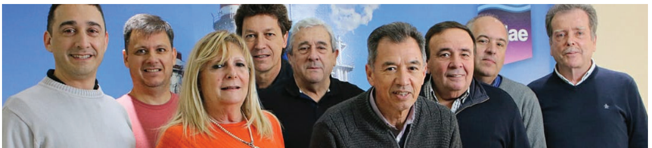
Miembros de la Comisión Directiva Central de APJAE.

Jubilarse no es algo sencillo. No sólo por los trámites que implica sino por el impacto que tiene en la vida de las y los trabajadores. Acompañar y asesorar a nuestros asociados en ese momento para garantizar sus derechos previsionales es otro de nuestros desafíos. En este sentido, celebramos el avance realizado junto a la Secretaría de Previsión y Acción Social, con el programa “AN-SES va a tu trabajo”. A través de esta iniciativa, dicho organismo capacita en temas previsionales a personas seleccionadas por las organizaciones gremiales. En nuestro caso, nos permite fortalecer los equipos de las diferentes seccionales, fa-