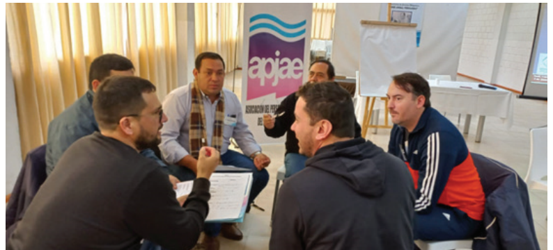
El debate fue enriquecedor en los grupos.