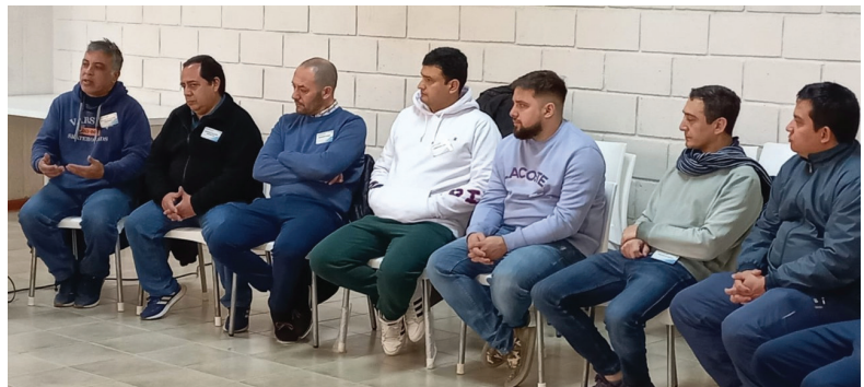
Las charlas fueron seguidas con atención.

La actividad incluyó actuaciones artísticas y al finalizar se entregaron certificados a los asistentes, que concluyeron con un gran entusiasmo y la convicción de haber sido parte de un encuentro que les permitió conocerse y ampliar su visión de una APJAE a nivel nacional. ■