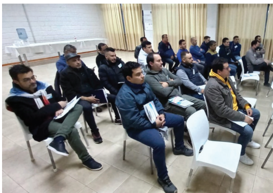
La representación de los jóvenes afiliados.