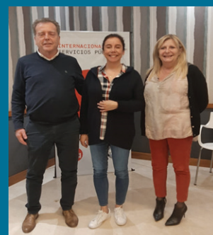
ISP REUNIÓN SUBRAC- SUBREMUJ