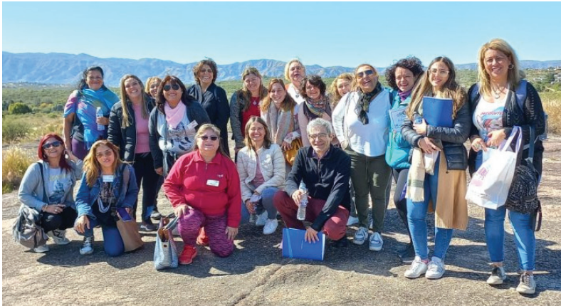
Hubo tiempo también para disfrutar de las sierras.