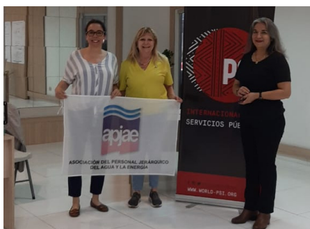
APJAE estuvo presente como miembro de la ISP.