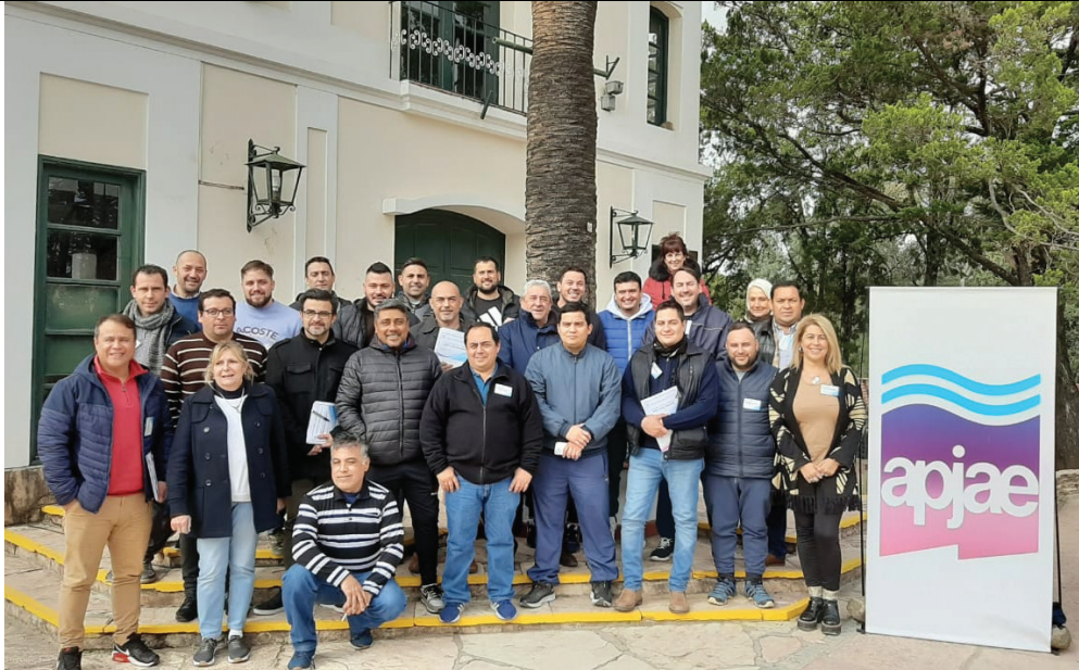
Foto grupal de los participantes del encuentro.