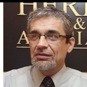
por Manuel Herbas*

Desde hace varios años el cannabis para uso medicinal tiene mucha difusión en Argentina, pero todavía hoy suele confundírsele con la marihuana con fines recreativos. Actualmente, existe legislación al respecto.