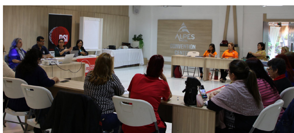
Apertura de la actividad de Capacitación.