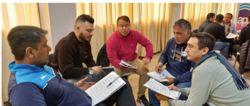
Los participantes se organizaron en talleres.