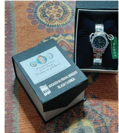
El obsequio a las asistentes.