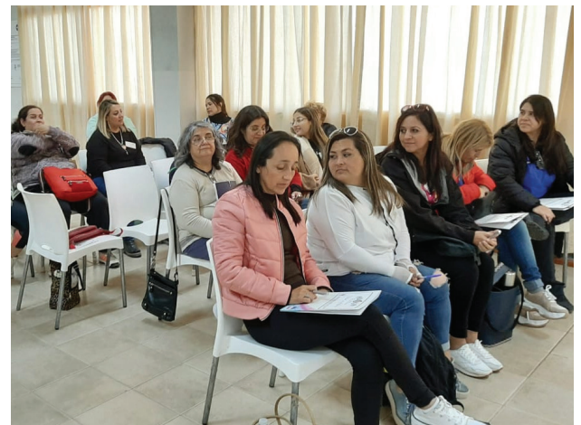
Las afiliadas durante una exposición.