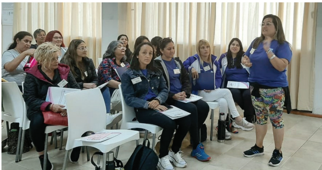
La participación fue activa en los talleres.