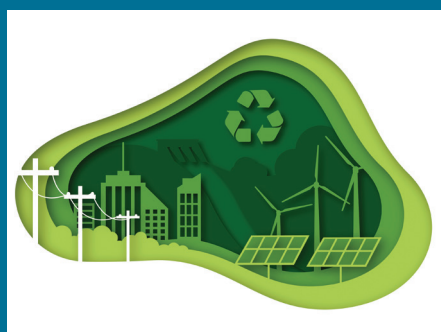
ENERGÍAS ALTERNATIVAS, POR SILLVANO A. CASTILLO