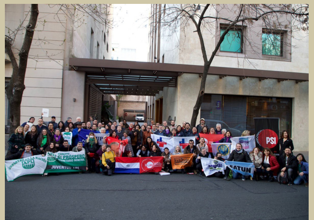
Los representantes sindicales participantes de la reunión de la SUBRAC

En la reunión, de la que participaron más de 85 representantes de las organizaciones miembro se debatieron temas de agenda hacia el Congreso, así como la situación política del Cono Sur, el multilateralismo, la crisis climática y el rol de los sindicatos, las prioridades de la Subregión en el marco del plan de acción y del Congreso Mundial y el voto político a favor del “Apruebo” en Chile.