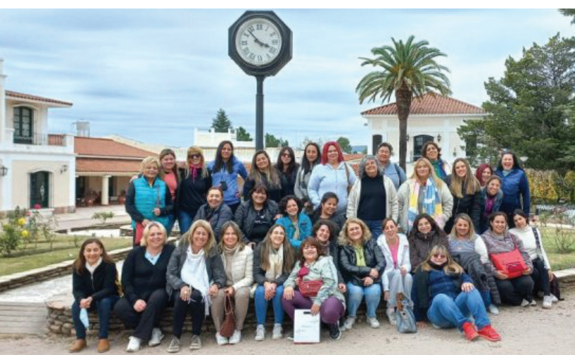
Las asistentes a la Jornada de las mujeres de APJAE.