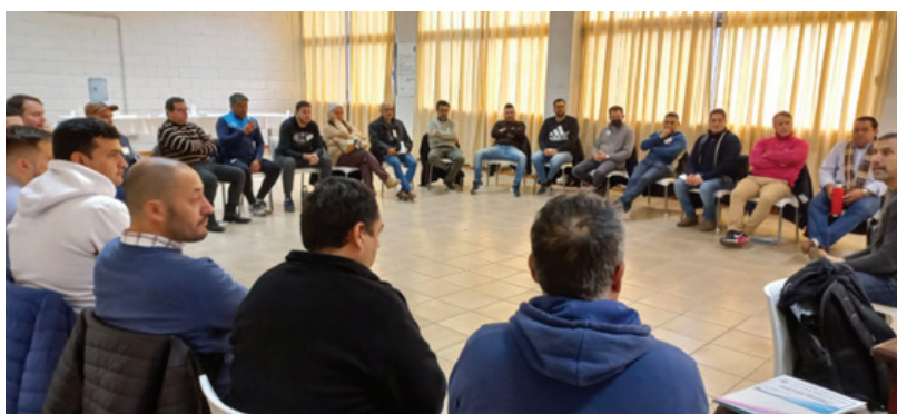
Un activo grupo de afiliados fue parte del encuentro.