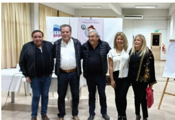
Miembros de la comisión directiva central.

Además de las charlas destinadas a dotarlas de herramientas para su desarrollo en la acción gremial, las participantes compartieron entretenimientos, paseos y diversas actividades que contribuyen a la integración y a su fortalecimiento como dirigentes. ■