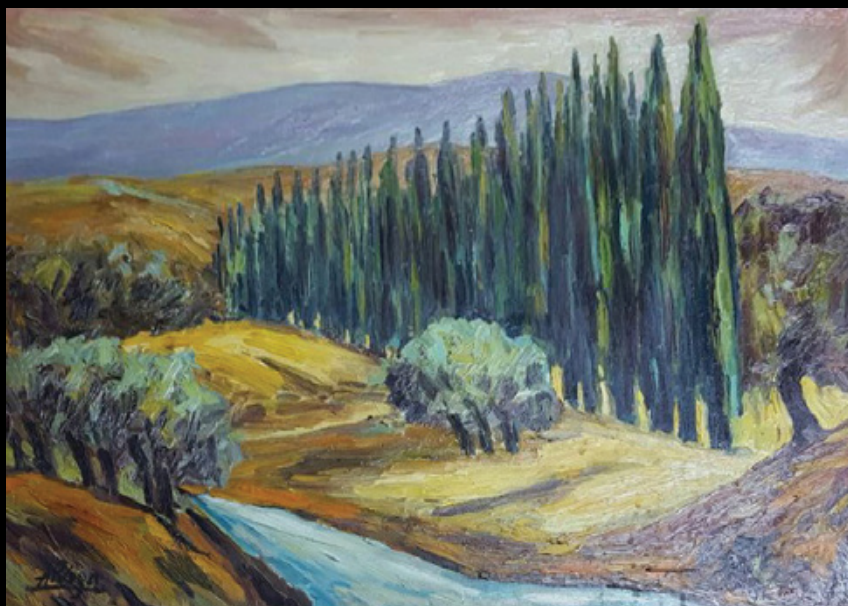
Paisaje con álamos Óleo