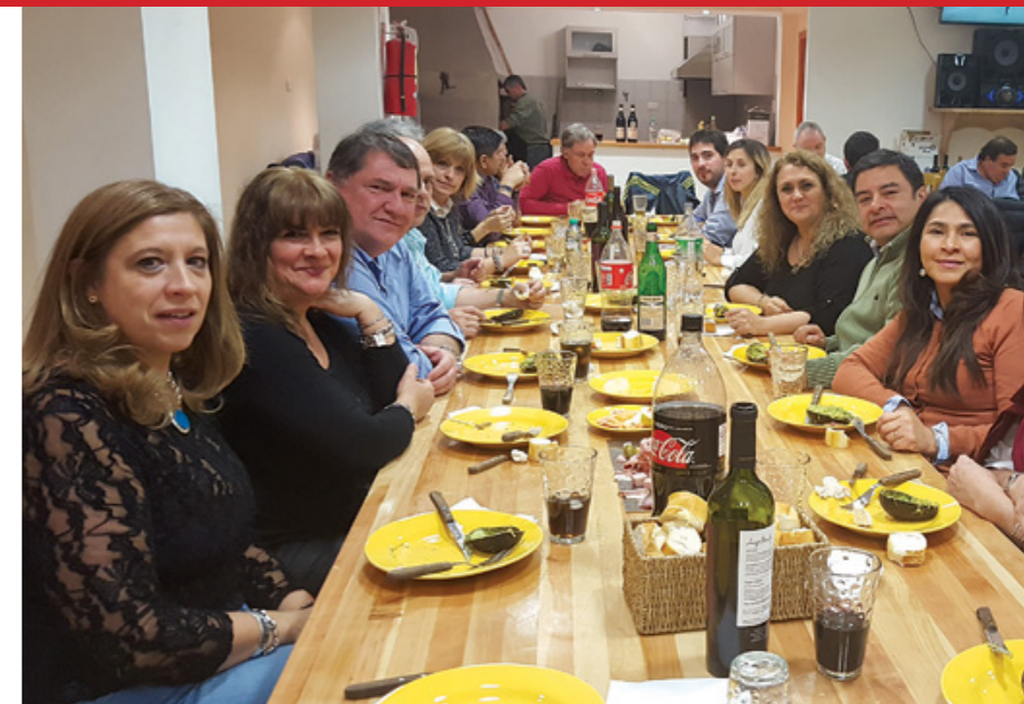
Cena con los afiliados de la seccional.

Por último, los miembros de la Comisión Directiva se dirigieron a la ciudad de Ushuaia, donde mantuvieron una reunión con afiliados de la Asociación que desarrollan funciones en la Dirección Provincial de Energía. El viaje de la Comisión Directiva fue una magnífica oportunidad para compartir actividades con los afiliados y funcionarios fueguinos, y conocer de manera directa la situación de la provincia, a la par que para disfrutar de las maravillas naturales de la región y de la hospitalidad de los amigos de la Seccional.