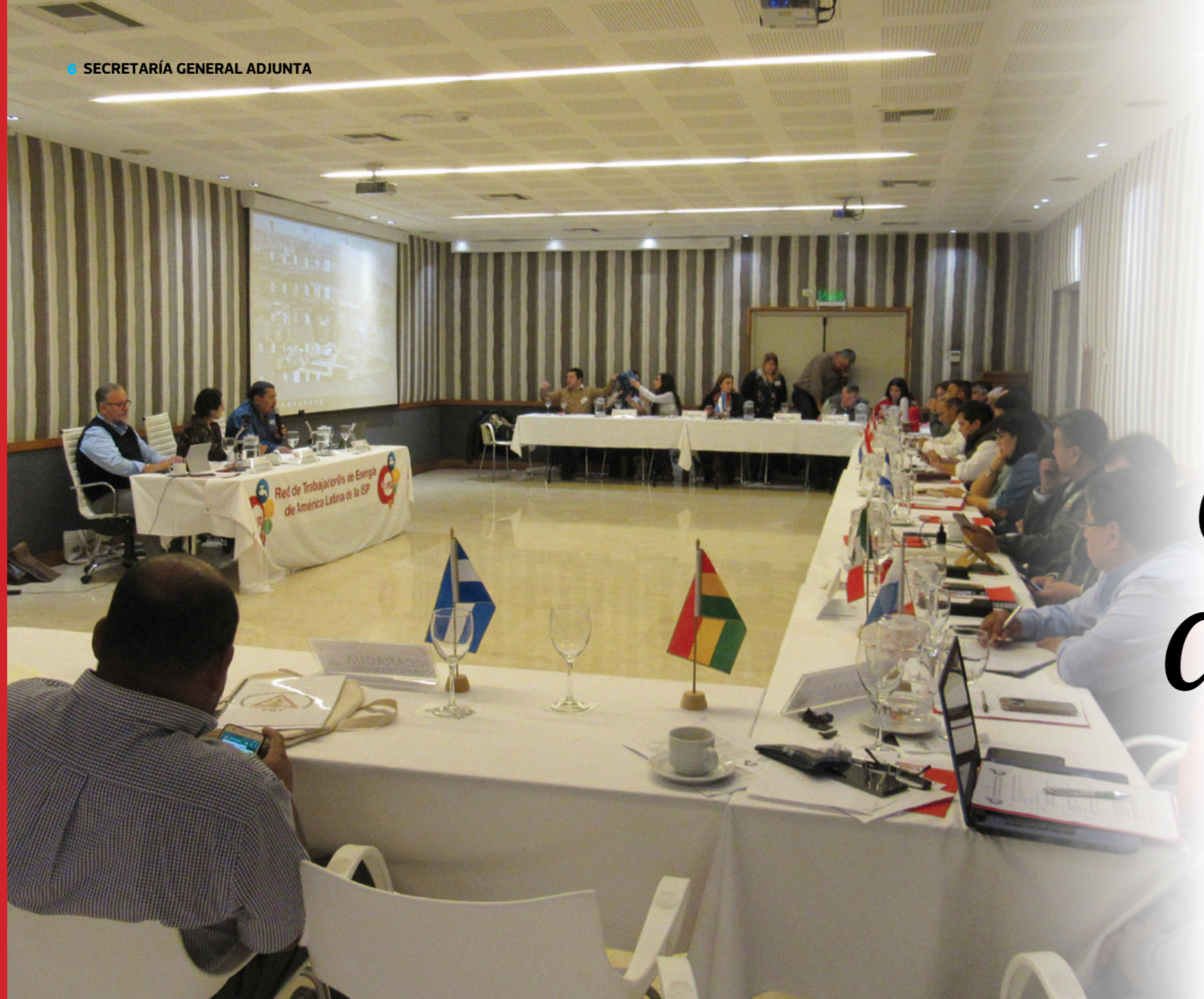
Apertura del Encuentro regional de trabajadores de la energía de la ISP.