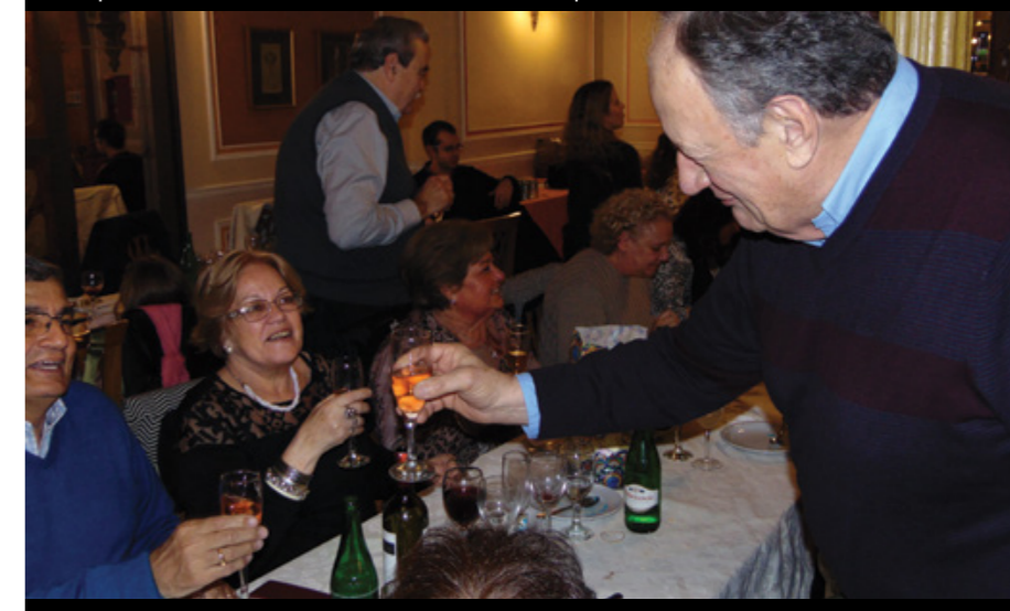
El aniversario fue una excelente oportunidad para unir lazos de camaradería.