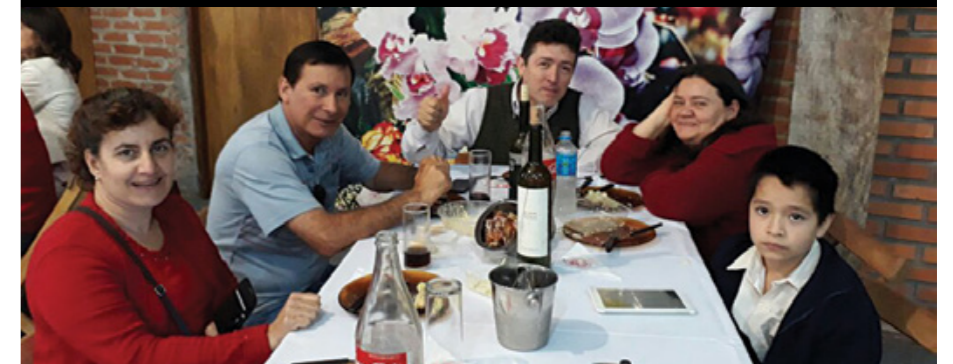
Las familias de los miembros de APJAE también se integraron al almuerzo.