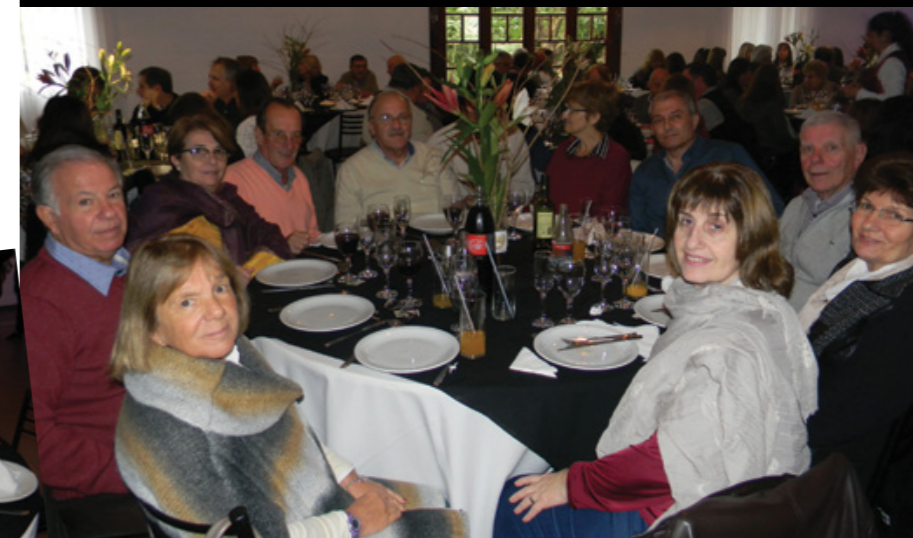
Los afiliados de la seccional San Nicolás junto a sus familias en el almuerzo de celebración de los 58 años de APJAE.