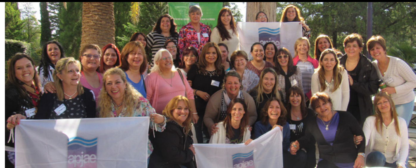
Las gremialistas de las empresas de Energía se capacitaron en el marco de la belleza serrana de Tanti.

de los nuevos métodos de educación y el acceso de las mujeres al voto fueron preocupaciones centrales en su vida, que llevó a varios congresos internacionales. Casada con Juan B. Justo, dirigente del Partido Socialista, con quien compartió su militancia, y la continuó durante toda su extensa vida. Durante la dictadura militar de 1976 a 1983 participó de comisiones de derechos humanos y en 1984 fue reconocida como Mujer del Año. Falleció en 1986 a los 101 años.