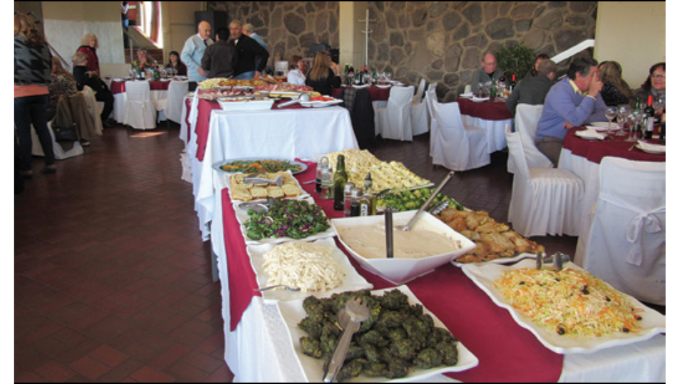
El exquisito buffet de la celebración.