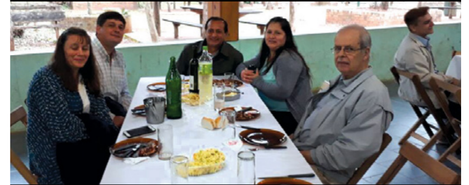
Afiliados de Misiones en un hermoso almuerzo.