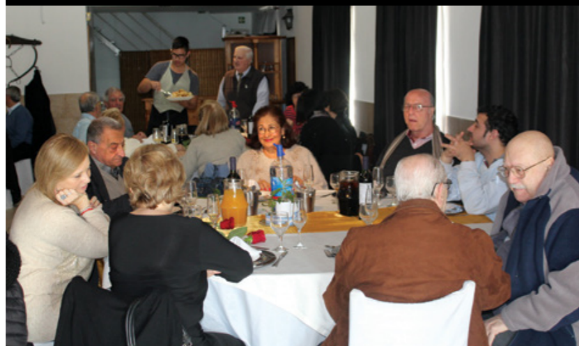
Dirigentes junto a afiliados activos y jubilados se unieron en la celebración.