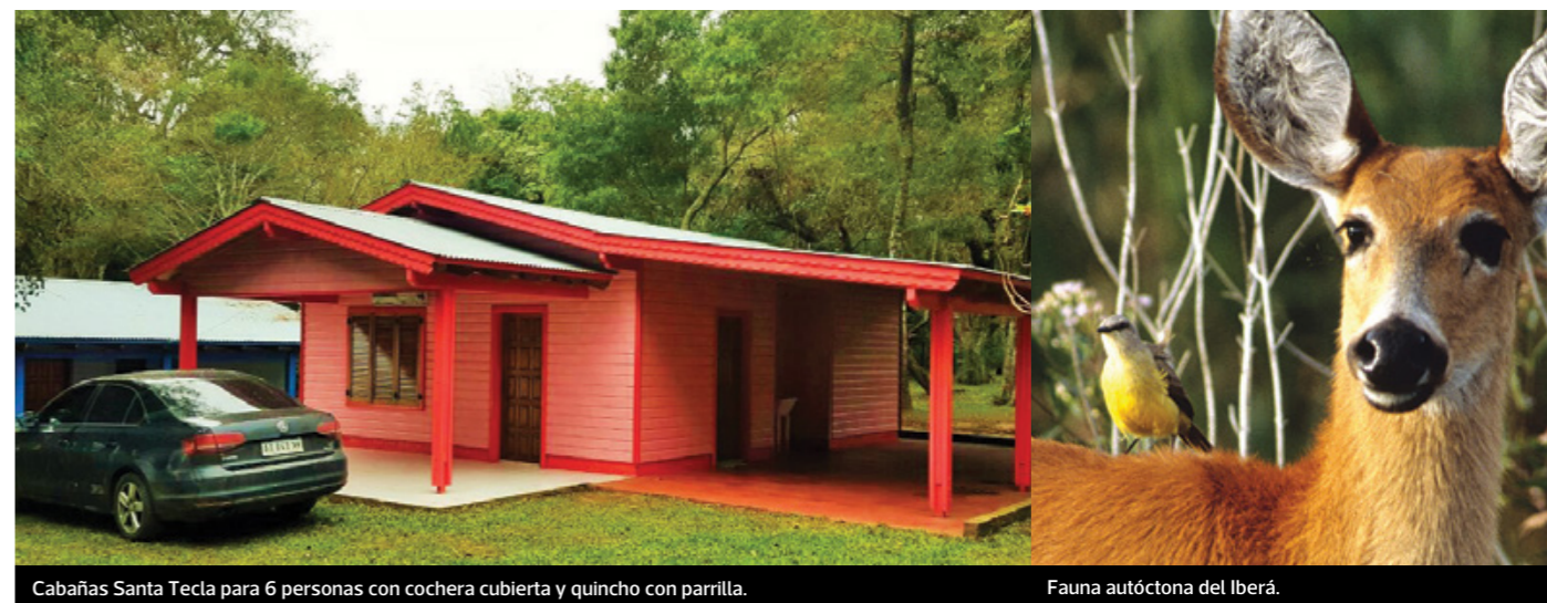
Cabañas Santa Tecla para 6 personas con cochera cubierta y quincho con parrilla.

El complejo de APJAE, situado en el km 1285 de la ruta 12, está a un poco más de dos horas por carretera de Corrientes capital y aproximadamente a una hora y media de Posadas, capital de Misiones, lo que lo hace especialmente atractivo como destino natural para los visitantes a las cercanas cataratas de Iguazú. •