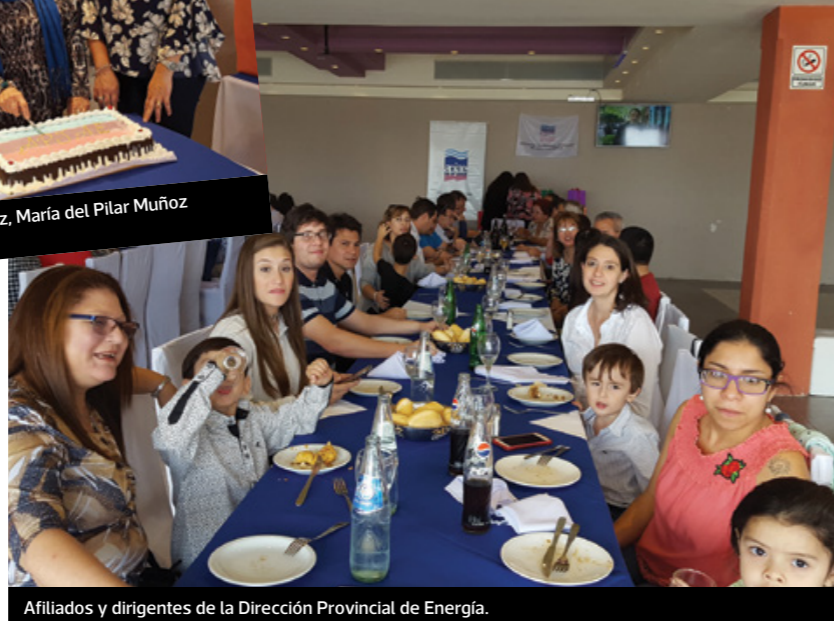
Afiliados y dirigentes de la Dirección Provincial de Energía.