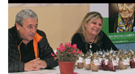
El secretario general de APJAE y la secretaria de Prensa y Capacitación en la apertura del Encuentro.