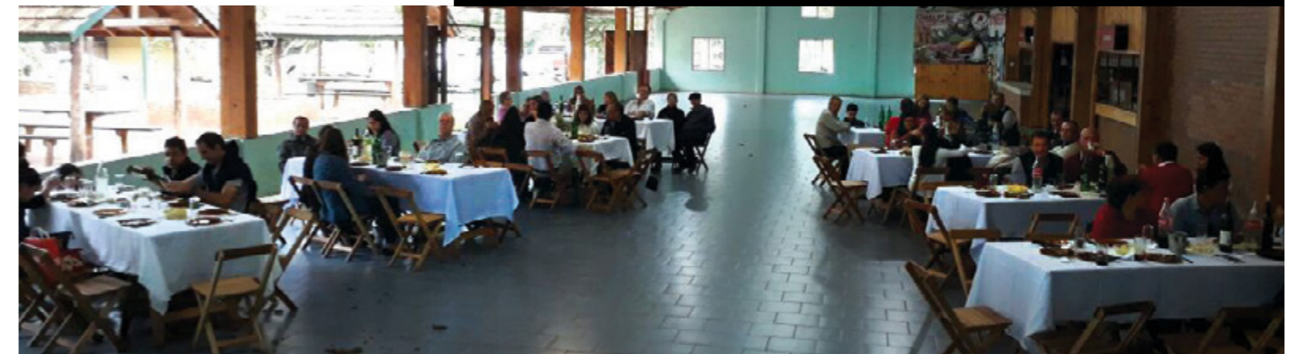
Vista del salón en Misiones.