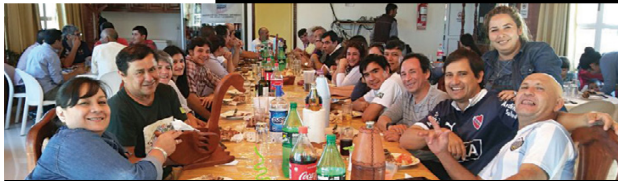
Asado de los miembros de la seccional Formosa en el Colorado.