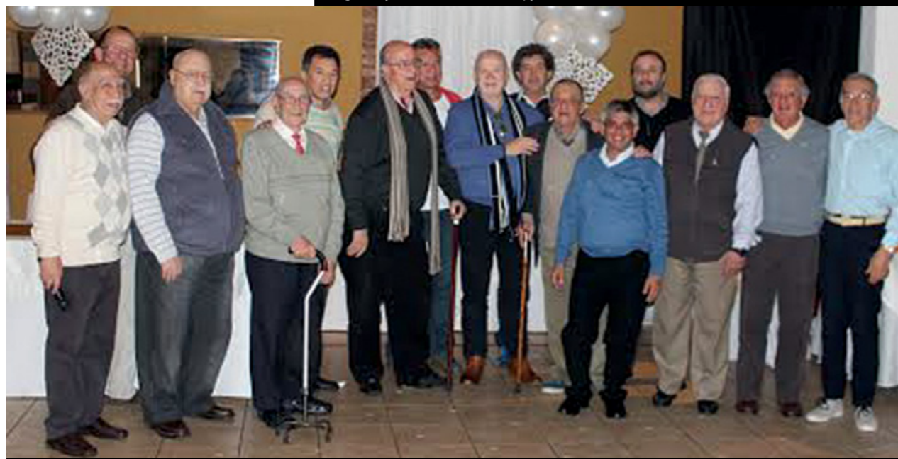
Diferentes generaciones de APJAE se unieron en el aniversario.