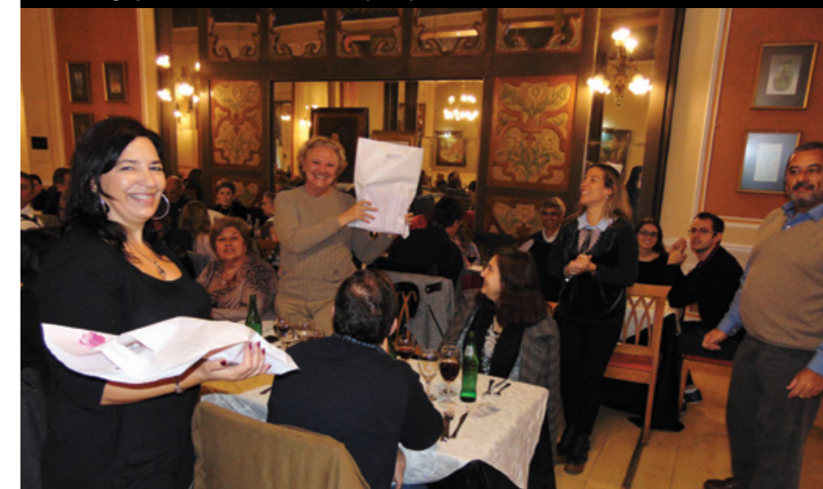
Las esposas de los afiliados recibieron un reconocimiento especial de la seccional.