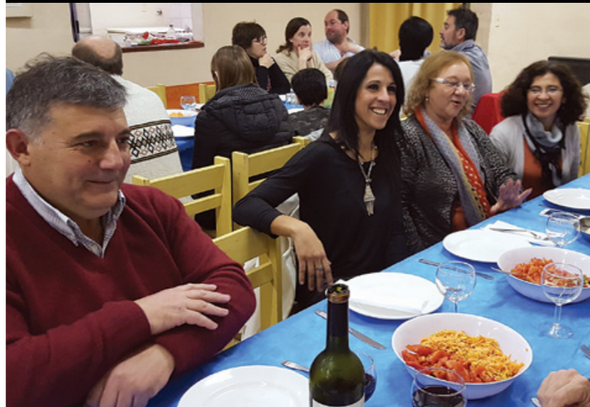
Afiliados de Trenque Lauquen en la celebración.