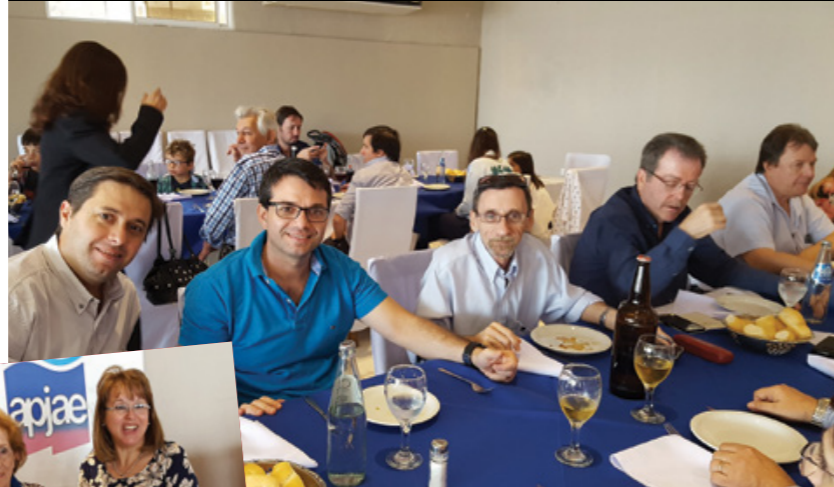
Afiliados y dirigentes de Transnea.