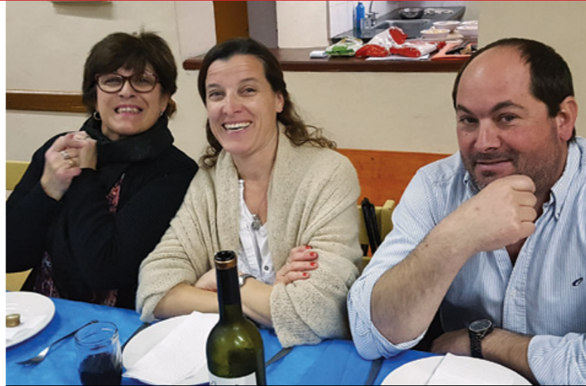
Afiliados de Catrilo celebrando el 58º aniversario de la APJAE.