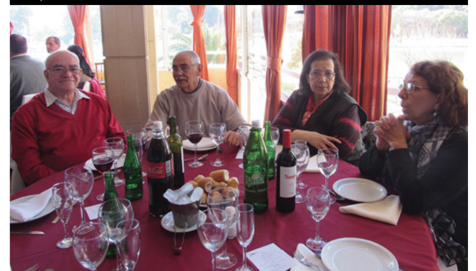
Afiliados y dirigentes locales compartieron la celebración con sus familias.