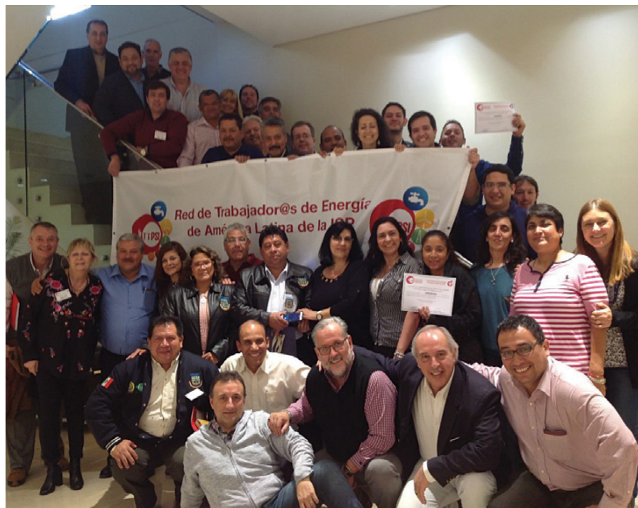
Representantes de América Latina y el Caribe reunidos en Buenos Aires en el Encuentro de Trabajadores de Energía.

Las jornadas fueron un importante espacio de reflexión y debate a partir del intercambio de preocupaciones generalizadas en los diferentes países en el contexto de la situación creada por la privatización de los servicios públicos. La manera de enfrentar la coyuntura, proponiendo alternativas viables, cuestiones como el deterioro de las condiciones salariales y de trabajo, el rol de las empresas multinacionales en la región y la posibilidad de influir en las políticas energéticas nacionales, constituyeron los ejes básicos compartidos por los representantes de la región. •