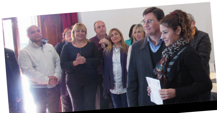
Entrega de certificados a las asistentes.