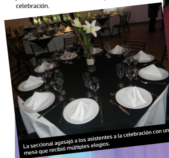
La seccional agasajó a los asistentes a la celebración con una mesa que recibió múltiples elogios.