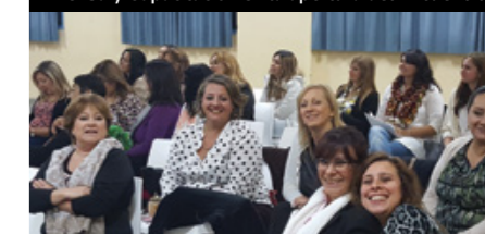
Las mujeres de APJAE participaron de una nueva edición de los encuentros organizados por la secretaria de Capacitación.