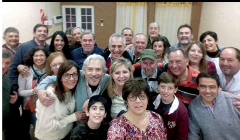
Afiliados de la seccional La Pampa.