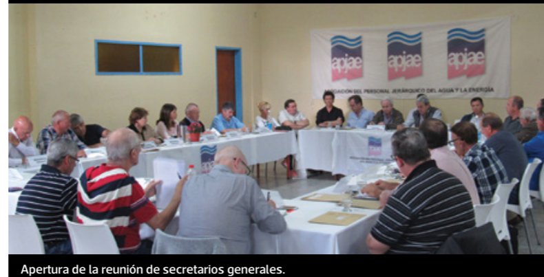
Apertura de la reunión de secretarios generales.