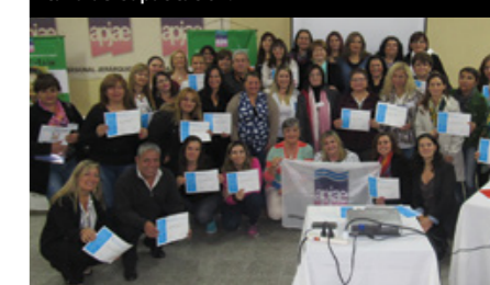
Las mujeres con sus certificados