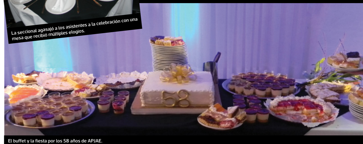
El buffet y la fiesta por los 58 años de APJAE.