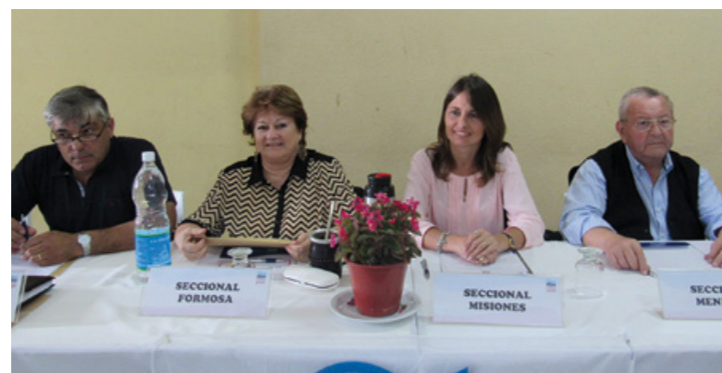
Secretarios generales de todo el país participaron de la reunión de Tanti.