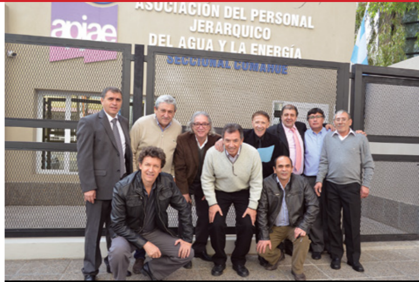
Dirigentes locales y nacionales en la inauguración de la nueva sede de la seccional.

Se destaca que el Acto tuvo una cobertura en "vivo y en directo" desde FM GALAS 89.7 Mhz y cobertura para prensa escrita por el Diario "La Mañana" de Cipolletti. CD Seccional Comahue agradece a CDC por el apoyo recibido y en especial a todos los afiliados de la Seccional que acompañan día tras día con su apoyo desinteresado el fortalecimiento de esta gestión.