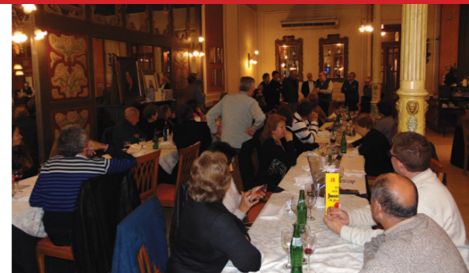
Un nutrido grupo de miembros de la seccional participo de la fiesta.