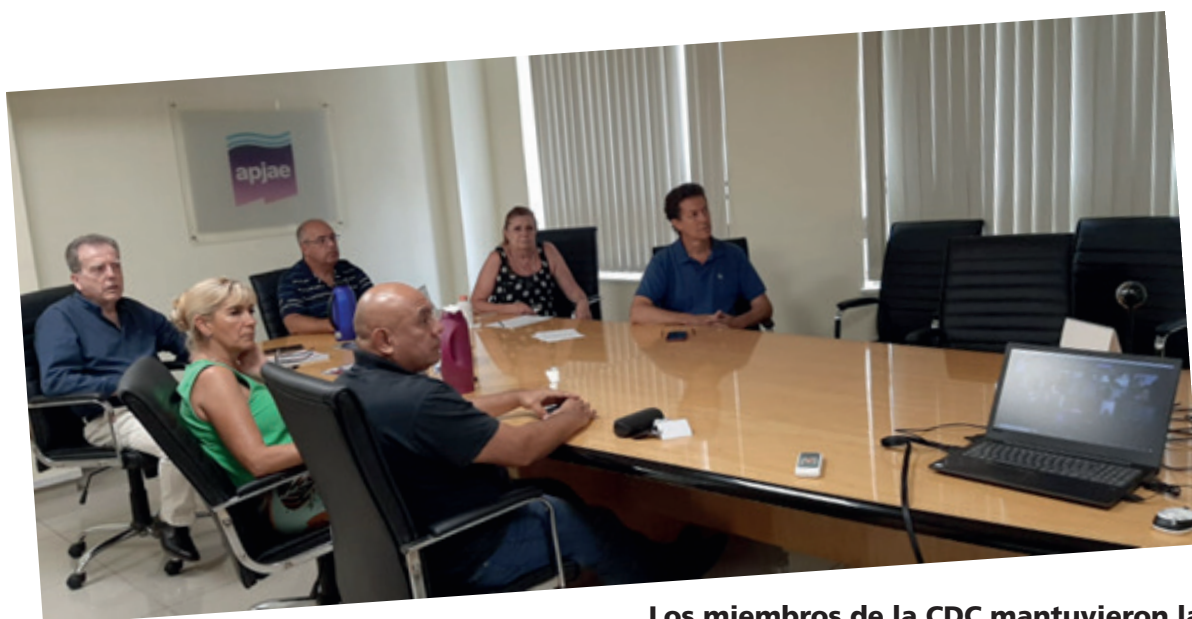
Los miembros de la CDC mantuvieron la reunión virtual con las seccionales